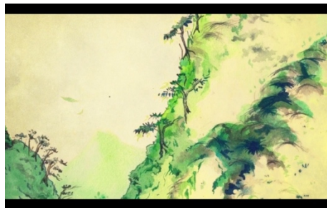
「どんぐり山の天下」ミュージックビデオ